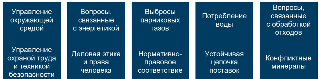
Рис. 1. Области устойчивого развития, подлежащие оценке

В течение года мы сотрудничаем с избранными поставщиками, обмениваясь информацией, предоставляя отзывы и (при необходимости) запрашивая корректирующие меры. Мы стремимся развивать и поддерживать прочные отношения с нашими поставщиками и постоянно информировать их о нашей стратегии и целях.